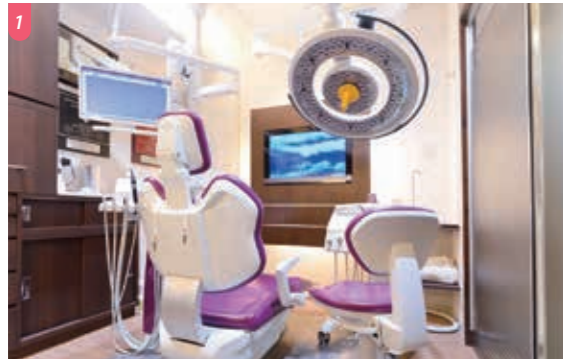
1 快適なユニットと外科用オペライトを新たに導入 2 受付ではコンシェルジュスタッフが患者を明るく迎えている 3 待合室には椅子だけでなくデスクも用意されている

す」 リニューアルを機に導入した外科用のオペライトは影がでにくく、より精密さを追求した治療が可能に。同じく導入した歯科用マイクロスコープは根管治療や歯茎の移植・縫合に使用している。さらに口腔内を3Dカメラで撮影し、歯型を取ることもなく修復物を作製するセレクトシステムを設置。その場で作製できるので、スピーディーな治療が可能となった。天