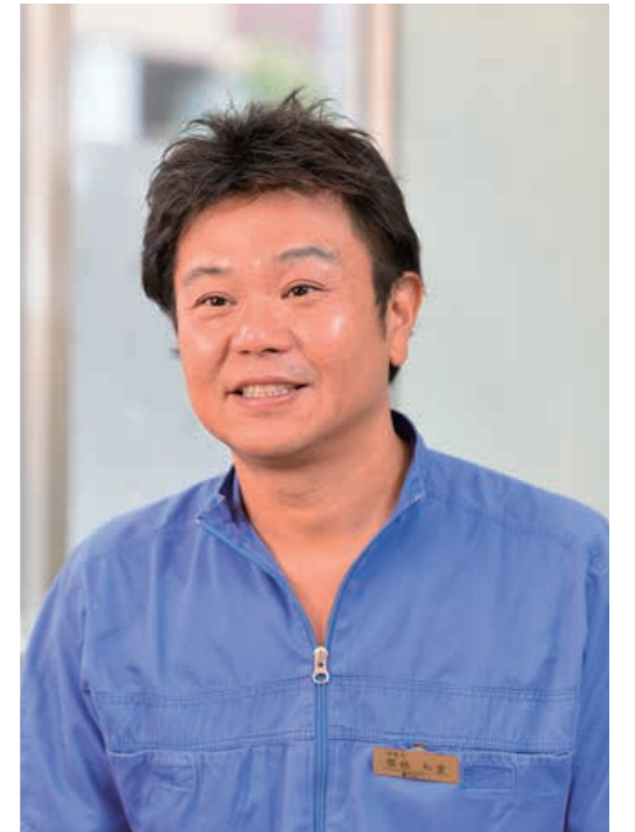
1990年鶴見大学歯学部卒業。幼少期を過ごした大森の隣町である大井に1999年開業。子どもの頃から車のプラモデルや鉄道模型などを作る細かい作業が大好きで、その手先の器用さが歯科医師という職業に生かされている。定期的に海外に出向き技術の習得に励むほか、さまざまなインプラントの学会に参加している。